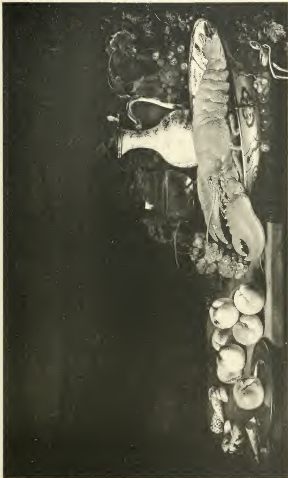
111. DOHAARDT - BAKKER - DE WILDT